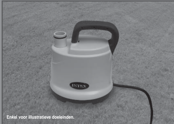
Enkel voor illustratieve doeleinden.

Vergeet niet om ook onze andere Intex-producten uit te proberen: zwembaden, zwembadonderdelen, opblaasbare zwembaden, speelgoed voor binnenshuis, luchtbedden en boten. Alles verkrijgbaar bij speelgoed/zwembadwinkels of kijk op onze website. Door ons streven naar continue productverbeteringen heeft Intex het recht productspecificaties en ontwerpen zonder kennisgeving te wijzigen, wat zou kunnen resulteren in wijzigingen in de handleiding.